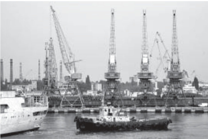
Окончание. Начало на стр. 1

Руководством страны и Минтранса были созданы условия для искусственного формирования кредиторской задолженности крупнейшего в стране Черноморского морского пароходства. Следствием этой политики были аресты и продажи с аукционов морских судов либо ввод их в офшоры. В результате в период с 1991 по 2007 год дефлит флота сократился почти в 5 раз — с 5,3 млн т до 1,13 млн т. Черноморское морское пароходство фактически лишилось своего флота. То, что годами создавалось и приумножалось нашими дедами и отцами, кормило одесские семьи, приносило доход и укрепляло репутацию государства, кануло в одночасье в Лету. Мы потеряли не только флот, мы утратили доверие к молодому украинскому государству. Одинадцать тысяч человек были оставлены без средств к существованию и какой-либо перспективы на будущее.