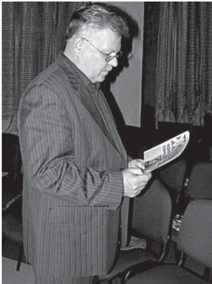
Начало на стр. 2

Поэтому чудо-оружия в экономике как такового нет. Речь идет о другом. О том, чтобы новая власть была профессиональной и ответственной. И понимала, что их потомкам жить в этом городе. Это уже будет немало важно. Убрать из власти временщиков. Посмотрите, как сегодня ведется строительство. Оно хаотично, эклектично. Самобытность Одессы пытаются убить. Выгорают дома, определяющие лицо города, его архитектурный облик и ценность — здание облпрокуратуры на Пушкинской, на той же улице здание бывшего английского клуба, в котором размещался музей морского флота, недавно огнем было уничтожен дом Руссова. А что вместо них? «Европа» на Дерибасовской, «Афина» на Греческой площади?!